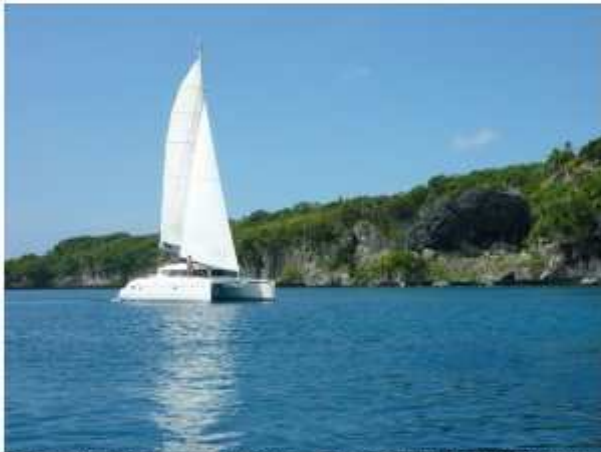
Einen Kat sicher manövrieren – das neue Buch von Thomas Brückner liefert dazu das nötige Wissen